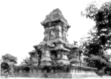
Gambar 16. Candi Singosari

Setelah Anda menyimak gambar candi Singosari tersebut maka simaklah uraian materi berikut.